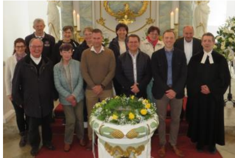
Beinahe der gesamte Kirchenvorstand kam, um den Lektoren ihren Dank zu bekunden